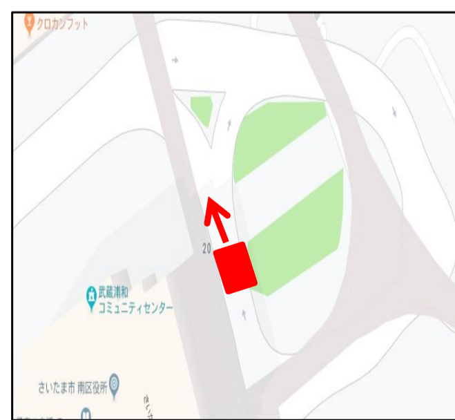
武蔵浦和 西口ロータリー-南区役所前