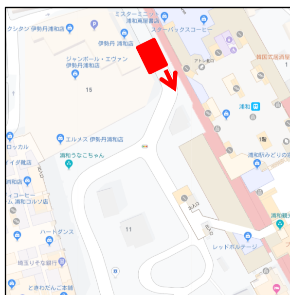
浦和駅アトレ側 北口改札上